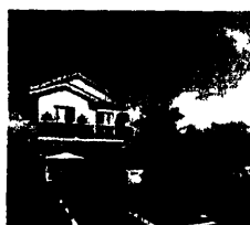
Figura 4 – Ilustrações das casas projetadas para o empreendimento, como estratégia de marketing para a venda dos terrenos. O adquirente não é obrigado a construir, mas caso queira edificar no seu terreno, pode optar por um dos projetos ou providenciar projeto particular

O segundo exemplo de empreendimento situa-se em área confrontante ao primeiro empreendimento (Art Life) e é identificado apenas como “Loteamento/Condomínio Recreio dos Bandeirantes”, com a seguinte divulgação pela internet 11 :