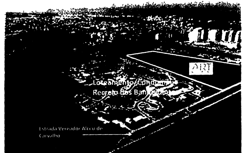
Figura 5 – Vista aérea do empreendimento imobiliário divulgado como “Loteamento/Condomínio Recreio dos Bandeirantes”, cuja implantação já está em andamento, situado em área contígua à área indicada para a implantação do empreendimento “Art Life” apresentado no 1º Exemplo